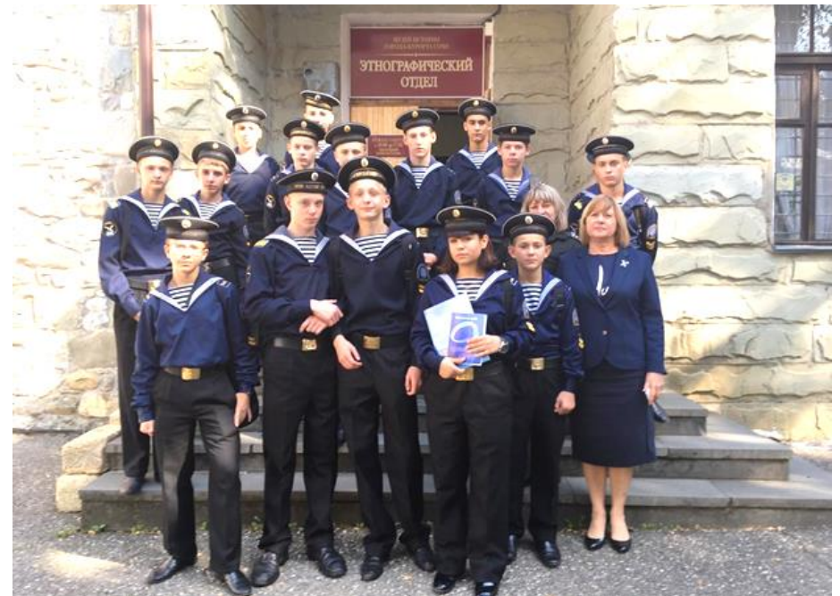
Воспитатель 21 учебной группы

А основной темой встречи, в 230-летнюю годовщину со дня рождения адмирала М.П. Лазарева, стал рассказ сотрудников музея о прославленном флотоводце, о его учебе в Морском кадетском корпусе в Москве, о его кругосветных путешествиях, о вкладе в развитие русского флота и преумножении славы Отечества.